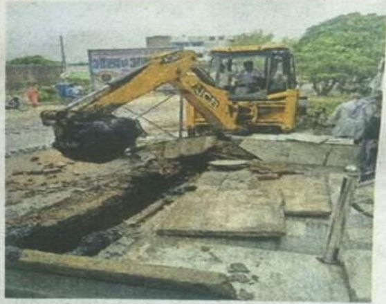
नगरा में जेसीबी से हो रही सफाई • जागरण वृहद रूप से सफाई अभियान चलाया जा रहा है। हर गली व मोहल्लों का सैनिटाइजेशन किया गया है।